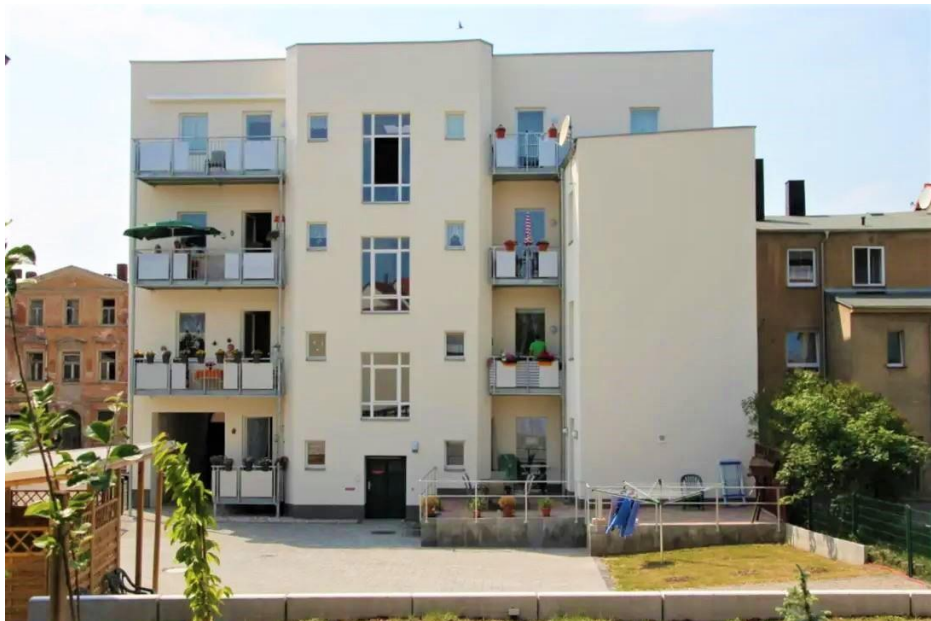
3. Hausansicht hinten