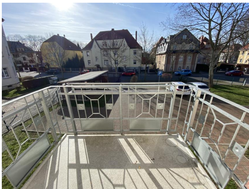
3. Referenzbild Balkon