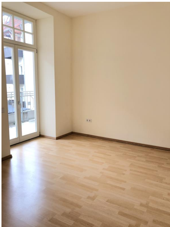
1. Referenzbild Wohnzimmer