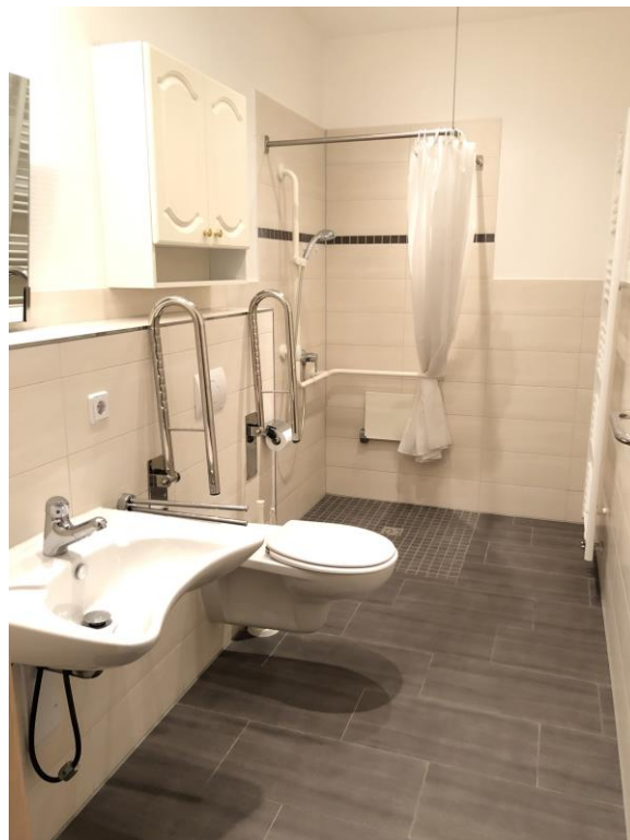
2. Referenzbild Badezimmer