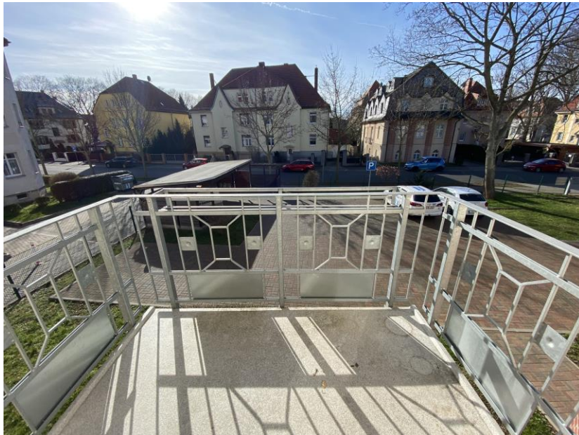
3. Referenzbild Balkon