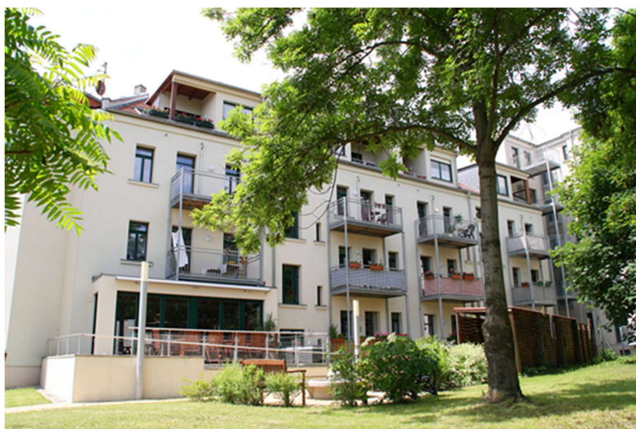
Hausansicht Hinterhof zum Gemeinschaftsraum