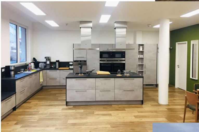
Küche im Gemeinschaftsraum